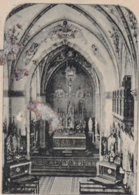
Inneres der Kirche