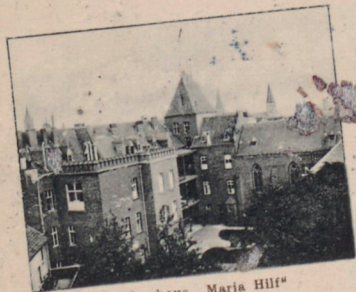
Krankenhaus „Maria Hilf“