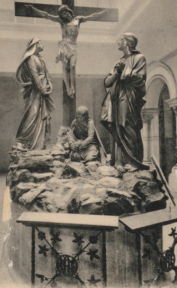
The Calvary, The Carmelite Church, Whitefriar's Street. Dublin.