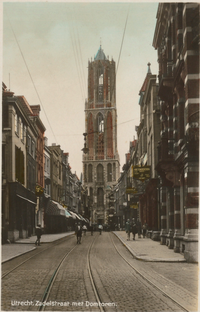
Utrecht, Zadelstraat met Domtoren.