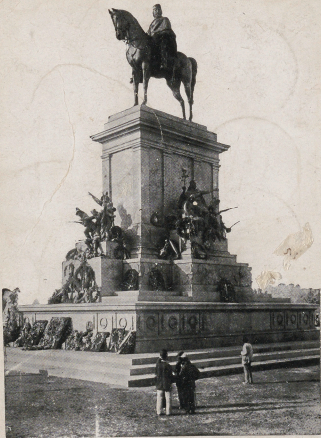
ROMA - Monumento a Garibaldi sul Gianicolo